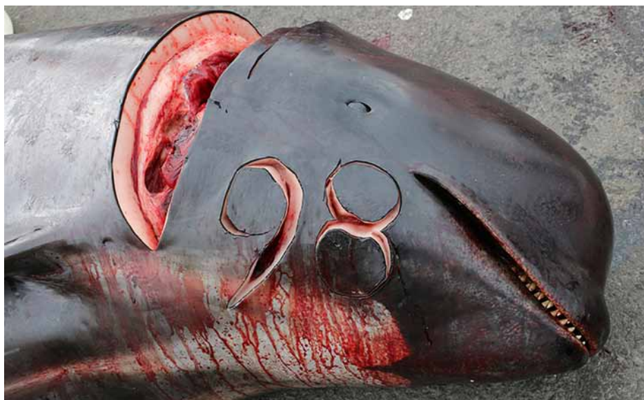
Nahoře: Následky masakru ve Hvannasundu. Dole: Další krvavá jatka ve jménu tradice Faerských ostrovů.

Mnoho staletí probíhá na Faerských ostrovech každé léto tzv. „Grindadráp“, lov kulohlavců. Během léta a počátkem podzimu jsou celá stáda těchto kytovců naháněna do fjordů a zátok, kde jsou obklíčena, zaháněna na břeh a poté brutálně usmrcena. Následně jsou vyvržena a malá část masa zpracována. Zbytek je vyhozen do moře nebo zpracován jako potrava pro zvířata. Dle oficiálních údajů každý rok přesáhne počet mrtvých velryb 1000 kusů. A zde nastupují dobrovolní strážci z řad Sea Shepherd. Každý rok se vracejí na Faerské ostrovy, aby legálním prostředky zabránili vybíjení těchto zvířat. Letos dobrovolníci pořídili obrazový materiál, který je šířen mezi širokou veřejností.