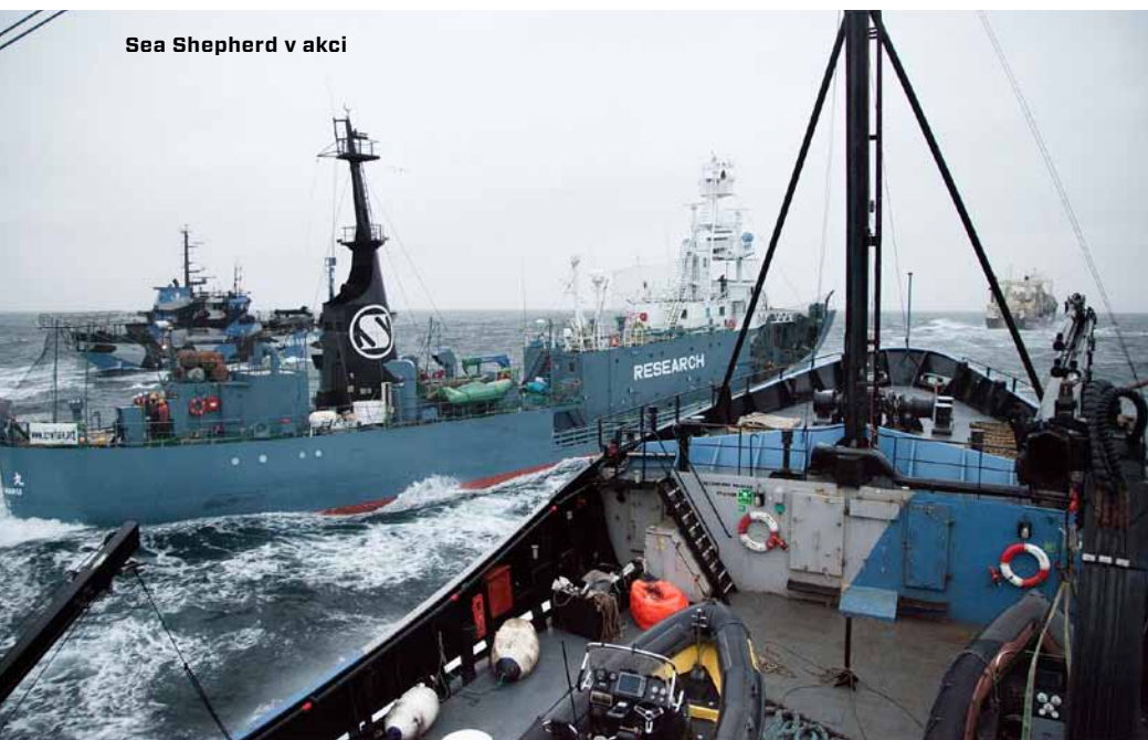
Sea Shepherd v akci

Trimaran je 35 m dlouhý, maximální rychlost je 24 uzlů, původně byl postavený jako charterová loď operující v Jižní Africe. Trimaran byl poprvé nasazen do expedice Sea Shepherd – No Compromise.