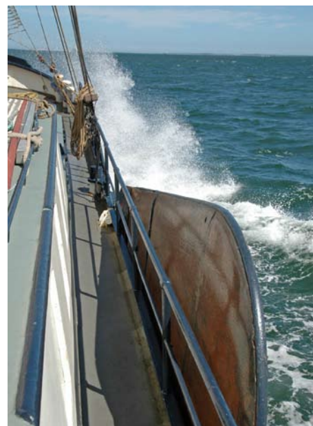
Na boku lodě jsou instalovány sklopné boční kýly.