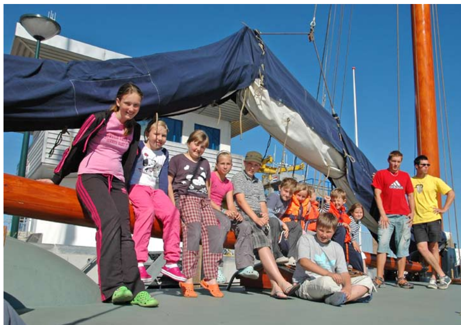
Na lodi si přijdou na své jak zkušení jachtaři, tak i mladé posily posádky.

Terschelling jsme si vybrali proto, že jsme tam nikdy nebyli. Plujeme a měníme kurzy, těsně před kulminací přílivu jedeme mírně na sever, po začátku odlivu stáčíme kurz na západ. Po třech hodinách plavby nás přepadl hlad, tak část posádky v kuchyni připravuje obložené chleby, jež chutnají >>>