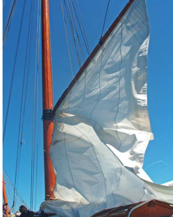
Ráhnové oplachtění není lehké a vyžaduje na vytažení síly celé posádky.

Moře tu má jinou barvu, než na jakou jsme zvyklí. Bylo zelenohnědé, zvlněné, zpěněné, ale neskutečně krásné. Někteří z nás se trochu opalovali, když přišel rozkaz od Aukeho vytáhnout plachty. Na přední a největší plachtu nastoupili mladí kluci cvičení z posilovny. Zpočátku točili vrátkem ostošest, ale jak šla plachta nahoru, síly ubývaly. Plachta je ke stěžni připoutána konopným lankem, na kterém jsou navlečené dřevěné korále, aby lano po stěžni lépe klouzalo. K tomu bylo zapotřebí dalšího chlapíka, který pomáhal s jednodušším vytažením plachty. Vytažení plachty trvalo deset minut. Následoval fok a nakonec plachta třetí.